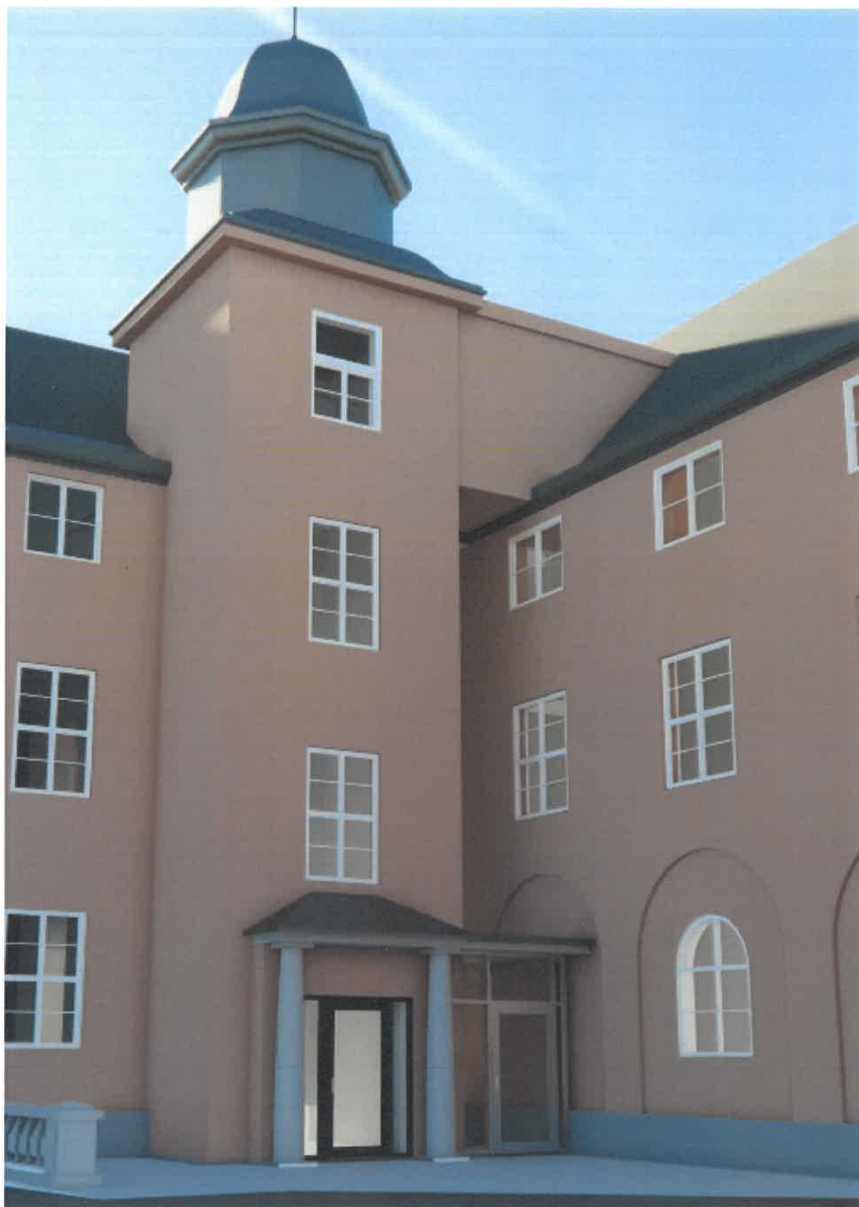
Figur 1 Forestått løsning med nytt tak og glassvegg foran vareheis