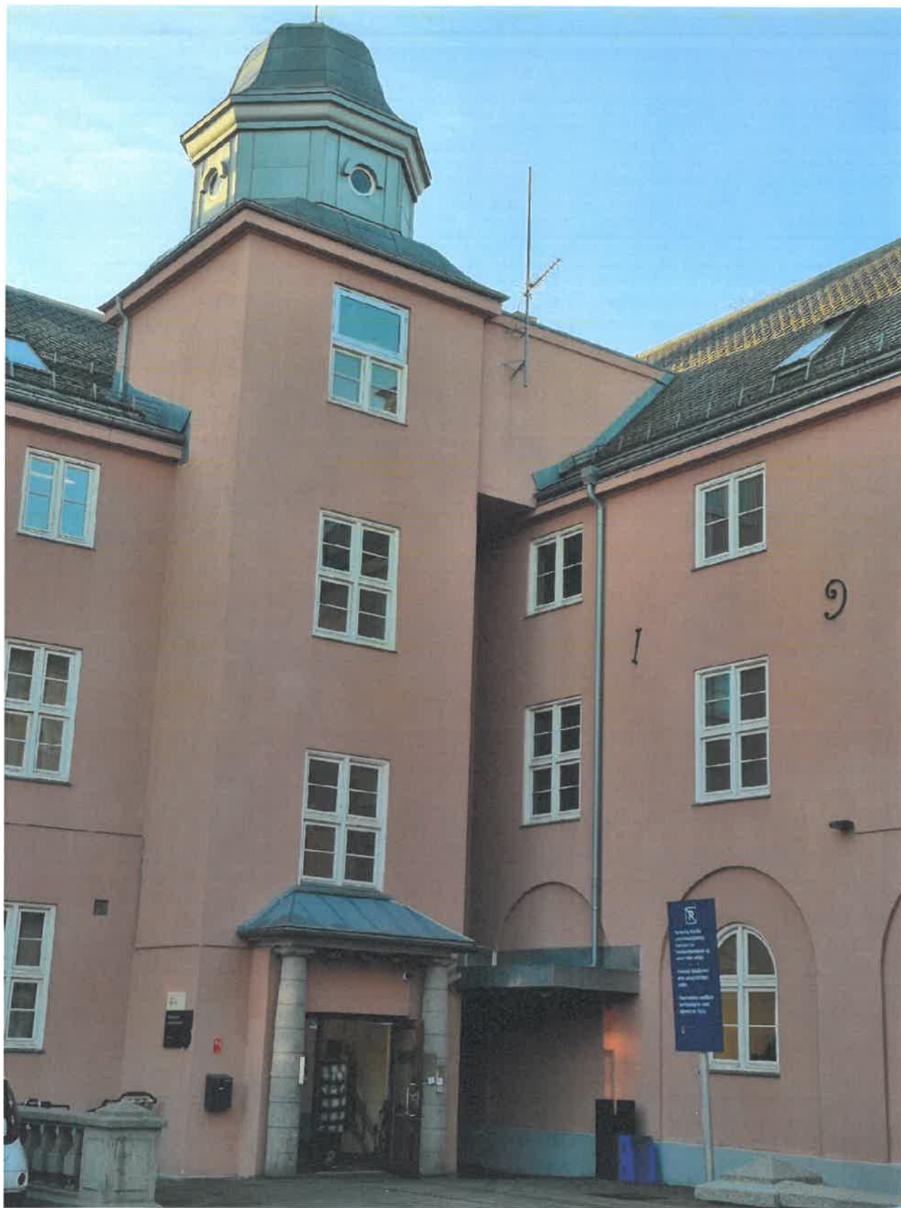
Figur 2. Eksisterende situasjon foran vareheis.