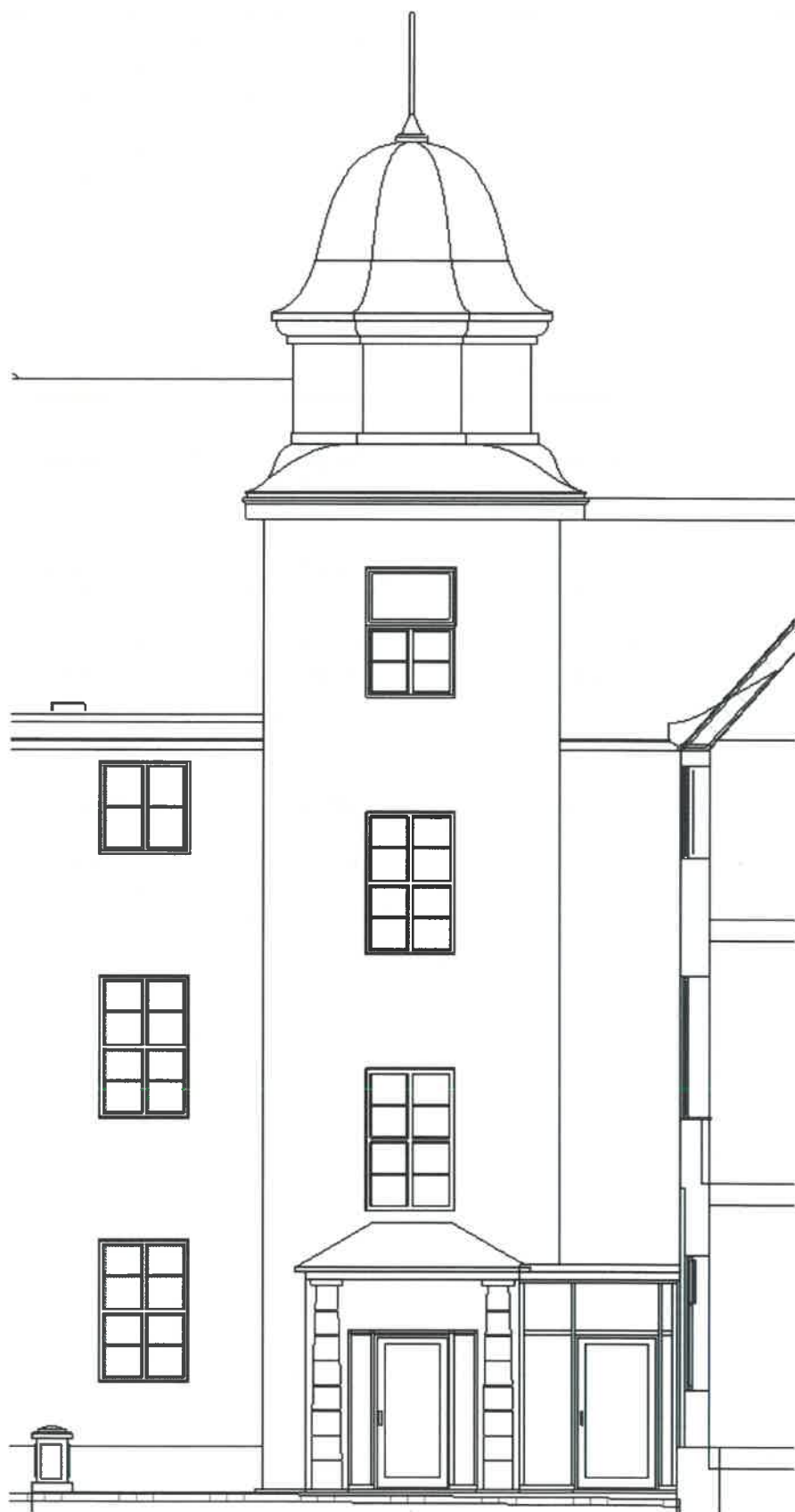
Figur 3. Oppriss fra modell